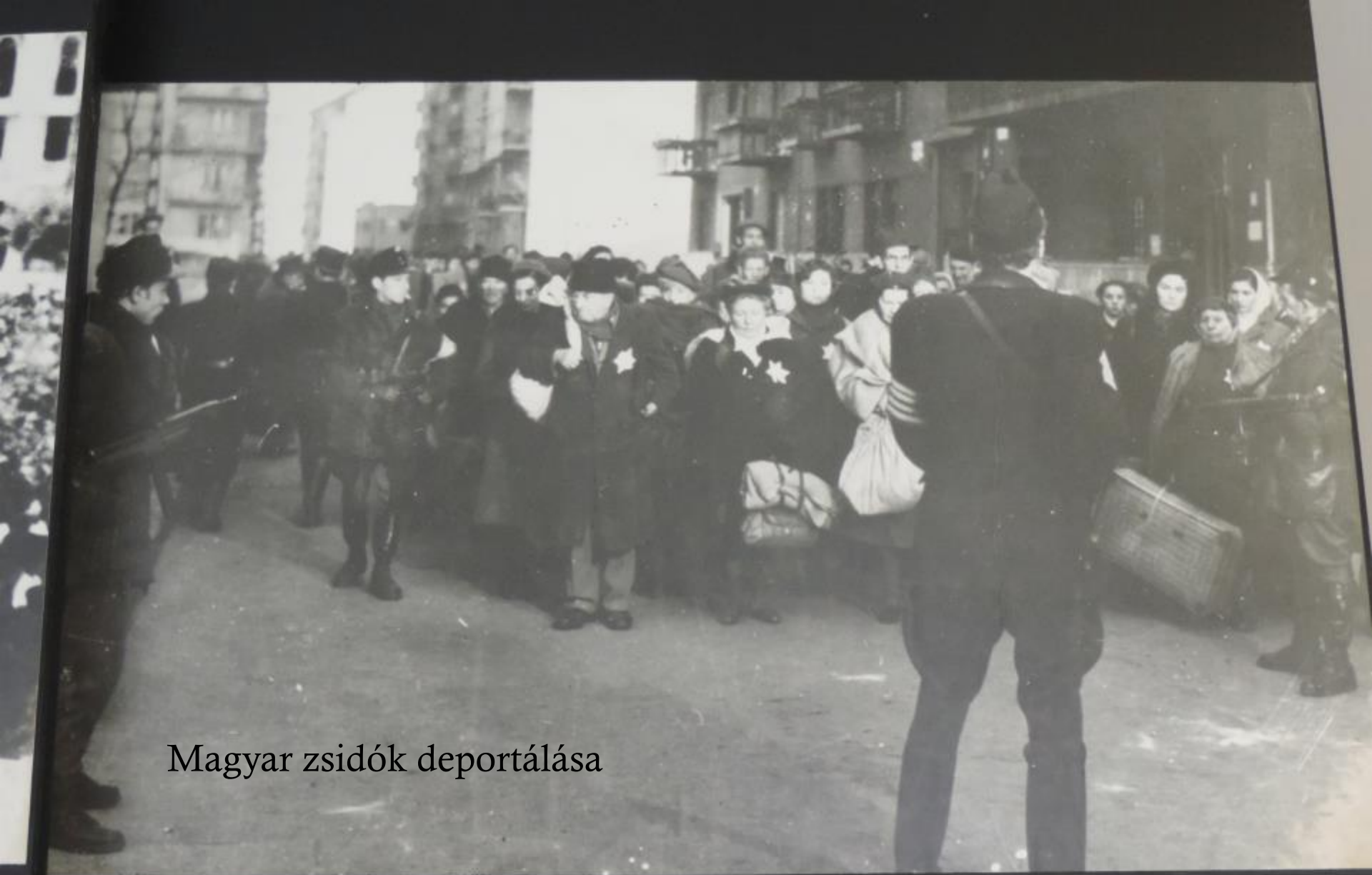
Magyar zsidók deportálása

PRZESIEDLANIE LUDNOŚCI ŻYDOWSKIEJ DO GETTA W BUDAPESZCIE, 1944 R. RESETTLEMENT OF THE JEWISH POPULATION IN THE BUDAPEST GHETTO, 1944.