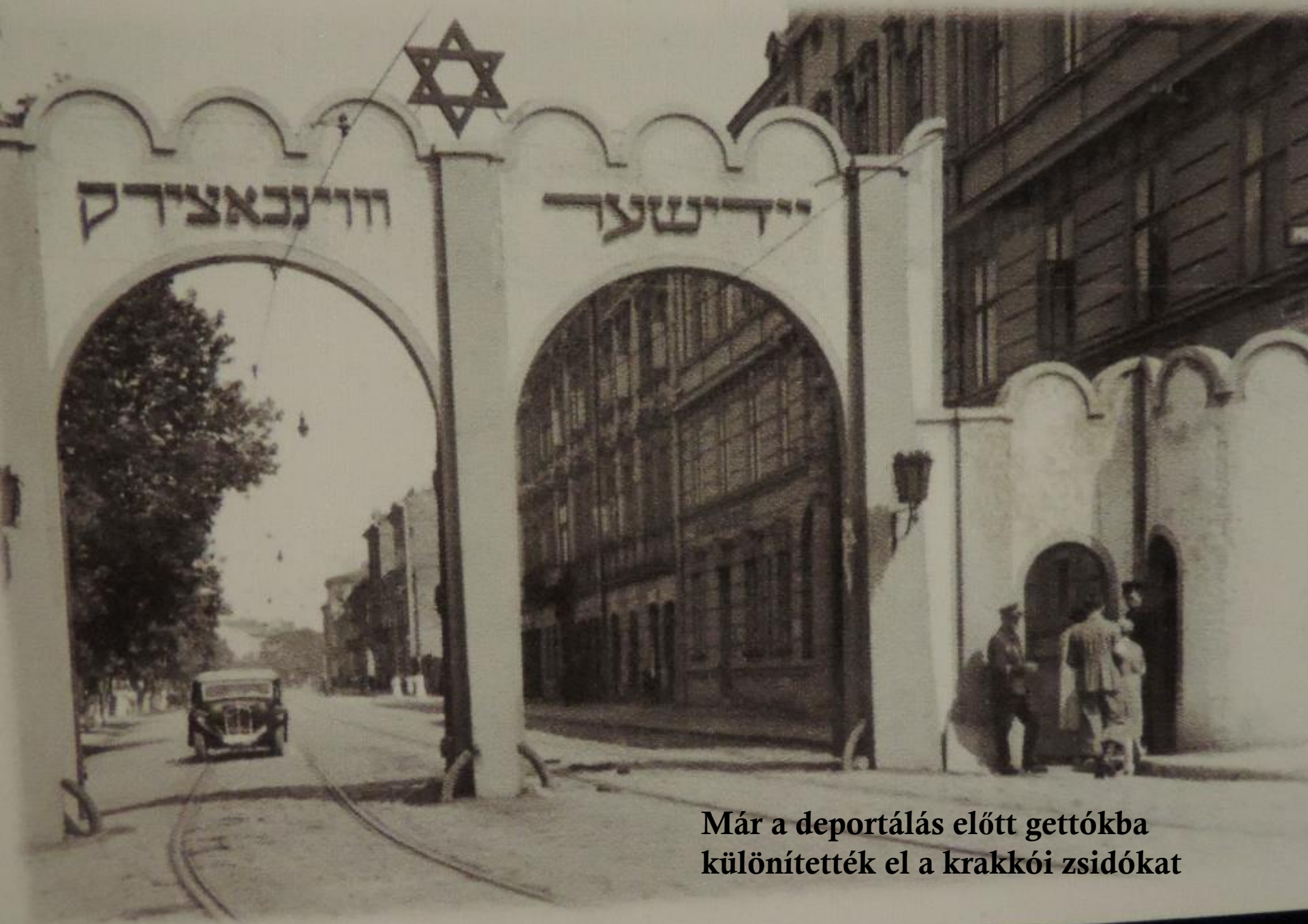
Már a deportálás előtt gettókba különítették el a krakkói zsidókat